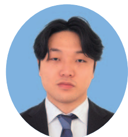
あぶみ 鏡 いつき 樹