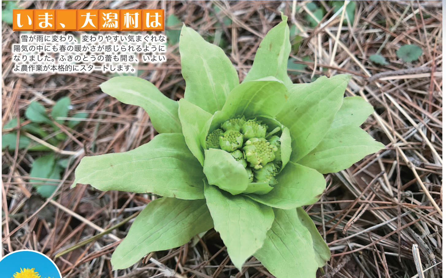
表紙写真：3月15日撮影

雪が雨に変わり、変わりやすい気まぐれな陽気の中にも春の暖かさが感じられるようになりました。ふきのとうの蕾も開き、いよいよ農作業が本格的にスタートします。