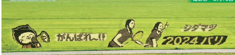
絵柄の左側は、町のマスコットキャラクター「ニャンパチ」。2人を応援する姿も見事に表現