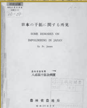
日本の干拓に関する所見

この報告書をもとに、日本政府はオランダと技術援助契約を結んだ上で、詳細な干拓事業計画を策定したのです。計画書は昭和32年に完成し、これをもとに工事が行われることになったのです。