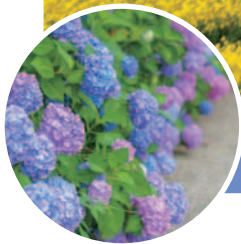
表紙写真：5月5日撮影

4月中旬から5月初旬、桜と菜の花祭りが開催されました。ゴールデンウィーク期間中は様々なキッチンカーやヒーローイベントなどもあり、多くの観光客で賑わいました。爽やかな5月の風に乗って鯉のぼりもぐんぐん泳いでいきます。