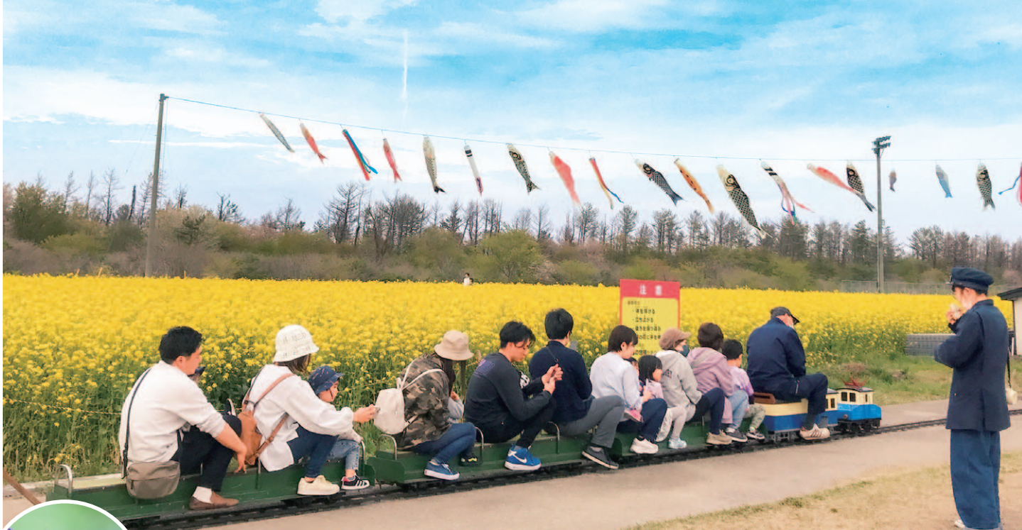
表紙写真：4月29日撮影

4月22日～5月7日までの約2週間「桜と菜の花まつり」が開催されました。ここ数年まつりが開催できなかったこともあり、今年はやはり特別、イベント盛り沢山！春の暖かな日差しのもと、まつり期間中には全国から約10万人の方々が大潟村に訪れてくださいました。